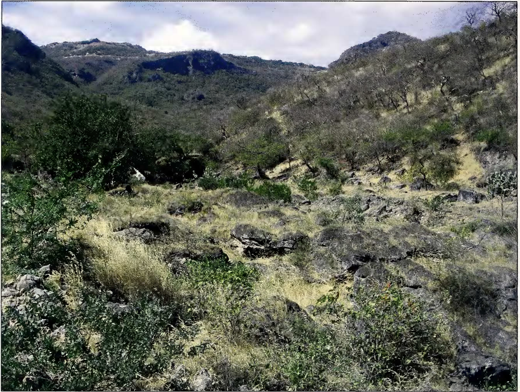
Fig. 8. Typenfundort Wadi Darbant, 500 m.